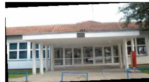
Područni objekt: Dječji vrtić "Borovo" Tel.: 032/422-973

Radno vrijeme: ponedjeljak - petak od 6,30 do 16,30 sati i po potrebi roditelja