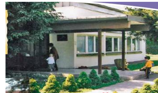
Centralni objekt: Dječji vrtić "Radost" Tel.: 032/441-288